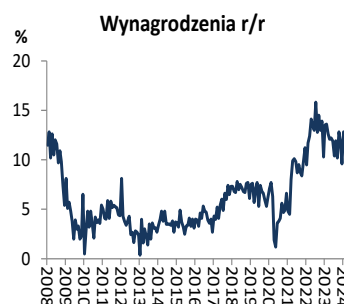
Wykres 1. Wynagrodzenia (dynamika r/r)

Podaż pieniądza M3 w styczniu 2024r. spadła o 0,5% m/m i wzrosła o 7,7% r/r po wzroście o 8,5% r/r w grudniu 2023r. Dynamika podaży pieniądza oscyluje wokół umiarkowanego trendu wzrostowego od 12 miesięcy.