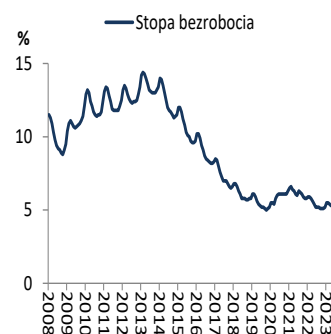
Wykres 2. Stopa bezrobocia rejestrowanego